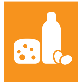
KATEGORIE 2 MILCH | KÄSE | EIER