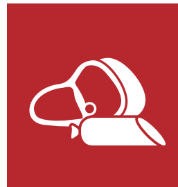
KATEGORIE 1 WURST | FLEISCH