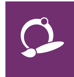
KATEGORIE 7 KUNST | SCHMUCK