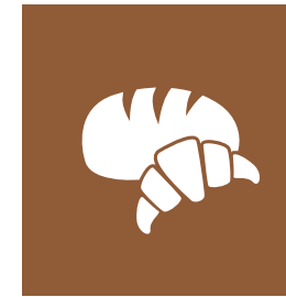
KATEGORIE 3 BACKWAREN