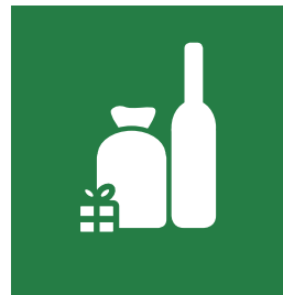
KATEGORIE 5 SPEZIALITÄTEN