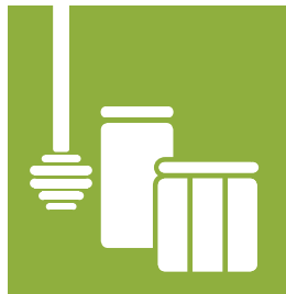
KATEGORIE 4 HONIG | MARMELADE | AUFSTRICH